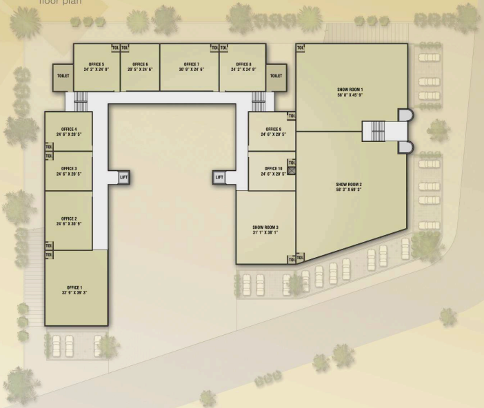
2nd to 4th floor plan