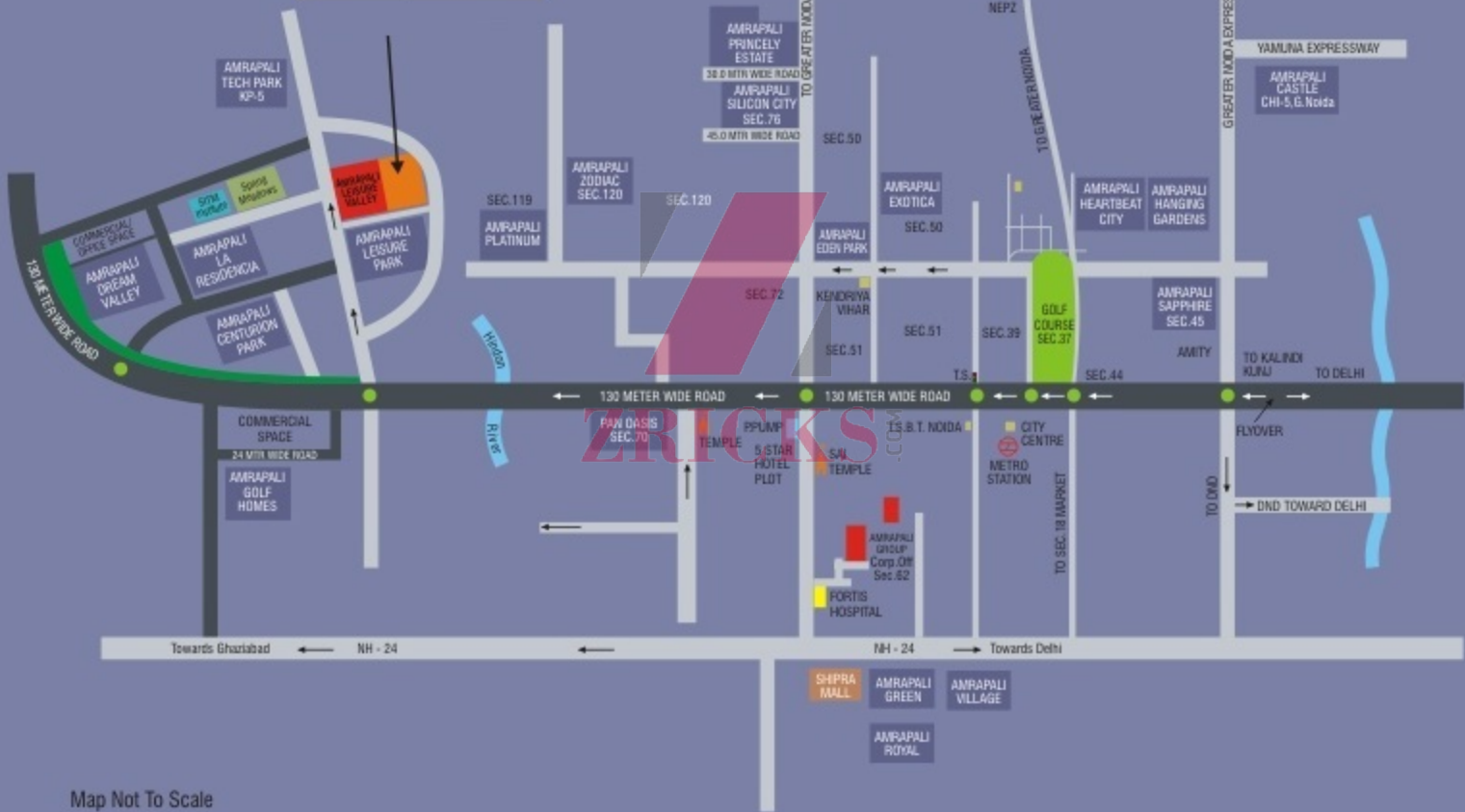
Map Not To Scale