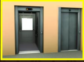
लिफ्ट की सुविधा।