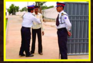
24 घण्टे सुरक्षा