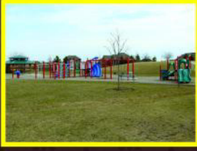
बच्चों के लिए पार्क